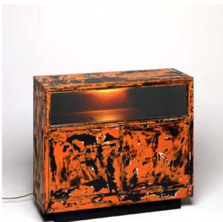
Anrichte Eigentum (Sunset)