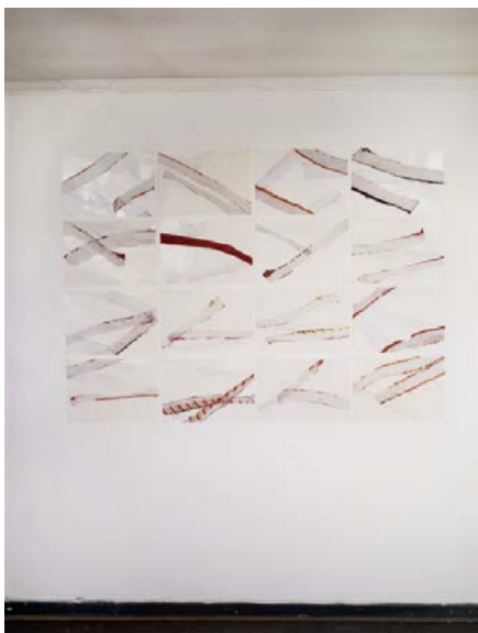
Stoffetzen mit Zeichnungen