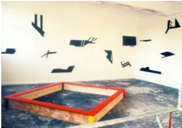
Bis zum Tezet