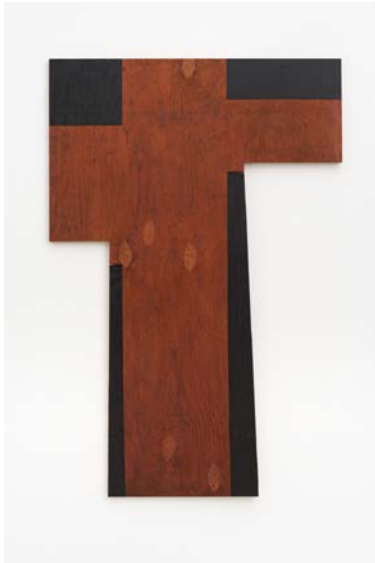
O.T. (Kreuz mit Schatten)