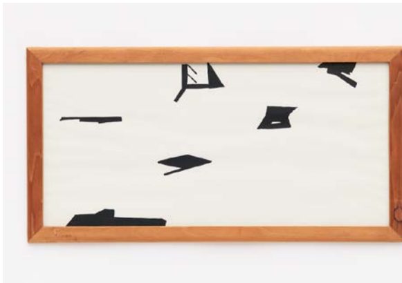
Zeichnungen für Schatteninstallation